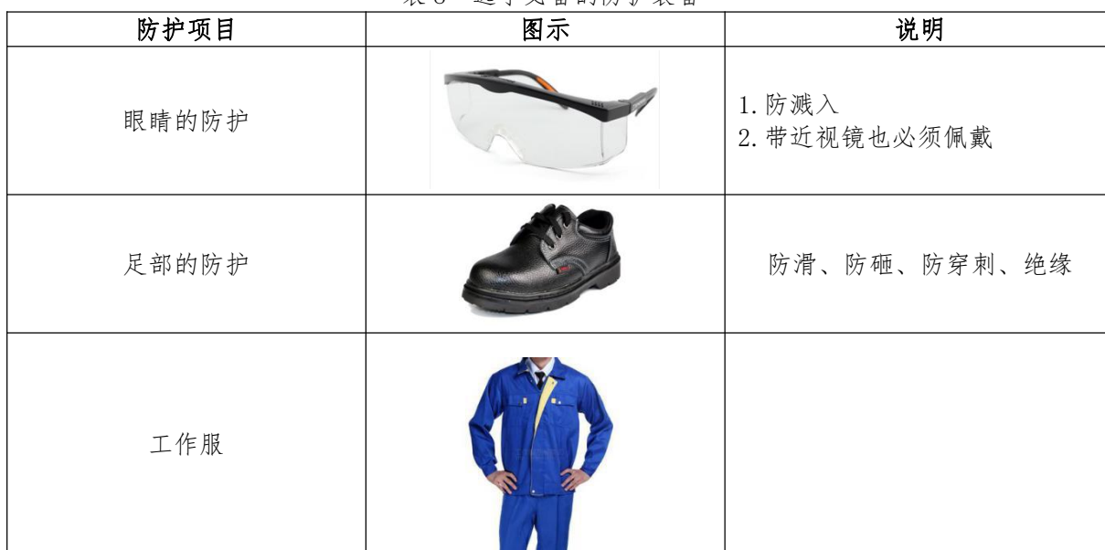
表8 选手必备的防护装备