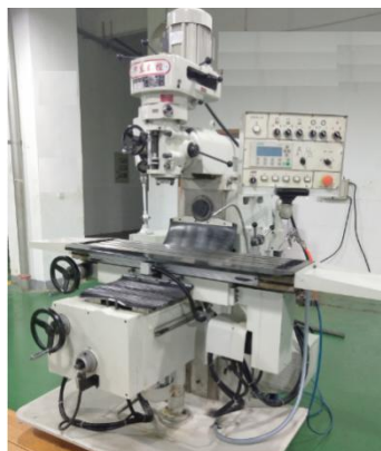
图 5 XN6330H 万能摇臂铣床

X7130 万能摇臂铣床具有广泛的万用性能，可以进行加工平面、斜面及铣槽、钻孔、铰孔、镗孔等，主要参数见表 3。