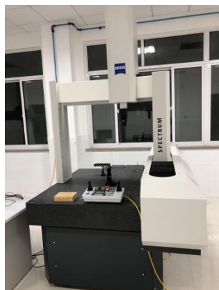
图 1 蔡司桥式三坐标测量机

蔡司桥式三坐标测量机和海克斯康桥式三坐标测量机，长度测量误差 E_0 自 1.5 + L/350 \mu\text{m} ，如图 1、图 2 所示。