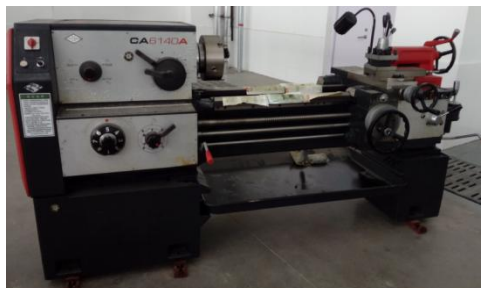
图 6 CA6140A 型车床

本机床适用于车削内外圆柱面、圆锥面及其它旋转面、车削各种公制、英制、模数和径节螺纹，并能进行钻孔、铰孔等工作，设备如图 6 所示，主要参数见表 5。