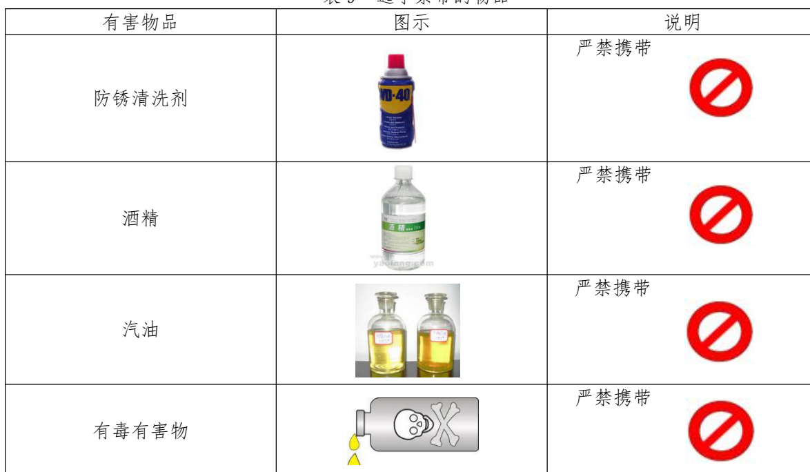
表9 选手禁带的物品