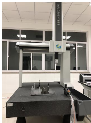
图 2 海克斯康桥式三坐标测量机