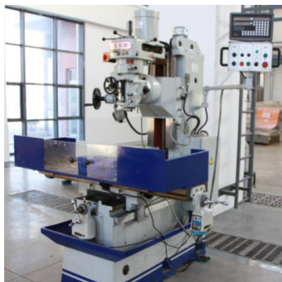
图 4 X7130 万能摇臂铣床

1. 铣床设备采用 X7130 万能摇臂铣床和 XN6330H 万能摇臂铣床，如图 4、图 5 所示。